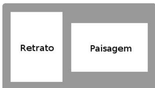
Forma correta de digitalização dos documentos

11.5.1. O candidato deverá digitalizar os documentos no formato RETRATO (vertical) ou PAISAGEM (horizontal), com as informações disponíveis para os avaliadores sem necessidade do uso do recurso de “girar visualização”, conforme imagens a seguir: