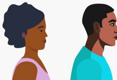
fotografia de perfil

5.26 O vídeo que será enviado ao CREA-AM deve seguir algumas recomendações, conforme abaixo: